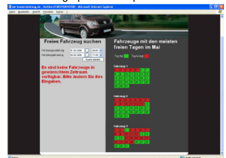
Neue graphische Disposition

Die Benutzer, die ein Fahrzeug mieten wollen, können eine Reservierung senden. Diese kann direkt in Ihre Disposition im Programm eingelesen und von Ihnen bestätigt werden. So haben Sie die Möglichkeit, ohne großen Aufwand und Kosten, sich und Ihre Fahrzeuge deutschlandweit zu präsentieren. Zeigen Sie Ihren Kunden jetzt unmittelbar , ob der von ihm gewählte Fahrzeugtyp im von ihm gewählten Zeitraum auch zur Verfügung steht und geben Sie ihm die Möglichkeit einer sofortigen verbindlichen Reservierung . Als besonderen Service für Firmenkunden oder langjährige Stammkunden können Sie diesen eine geschlossene Benutzergruppe anbieten. Eine besondere Feinheit des Programms ist, dass ein Kunde für einen bestimmten Zeitraum, den er wünscht, nur ein Fahrzeug der Kategorie angezeigt bekommt, nicht alle in dieser Kategorie. Sollte kein Fahrzeug in diesem Zeitraum komplett frei sein, werden die drei Fahrzeuge , die im Wunschzeitraum mit den meisten freien Tagen verfügbar sind, angezeigt.